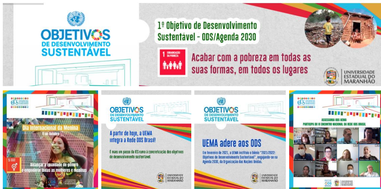
Figura 5. Exemplos de artes de divulgação das ações ODS Uema.