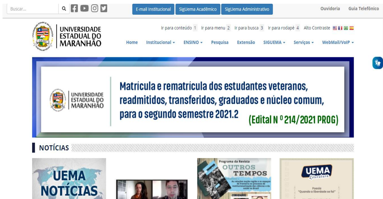
Figura 3. Imagem da página oficial da Uema (www.uema.br)