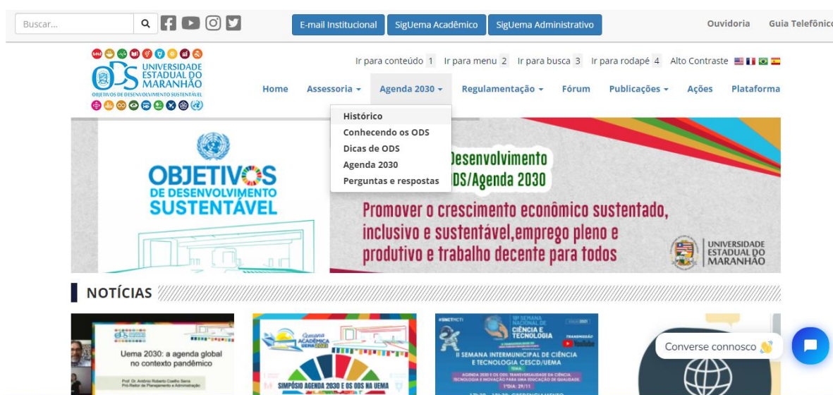
Figura 4. Página oficial da Assessoria Especializada na Articulação dos ODS na Uema ( https://ods.uema.br/ )

A página apresenta informações qualificadas sobre o histórico dos ODS, a Agenda 2030, os 17 ODS e suas respectivas Metas, Dicas ODS e um conjunto de perguntas e respostas sobre os ODS.