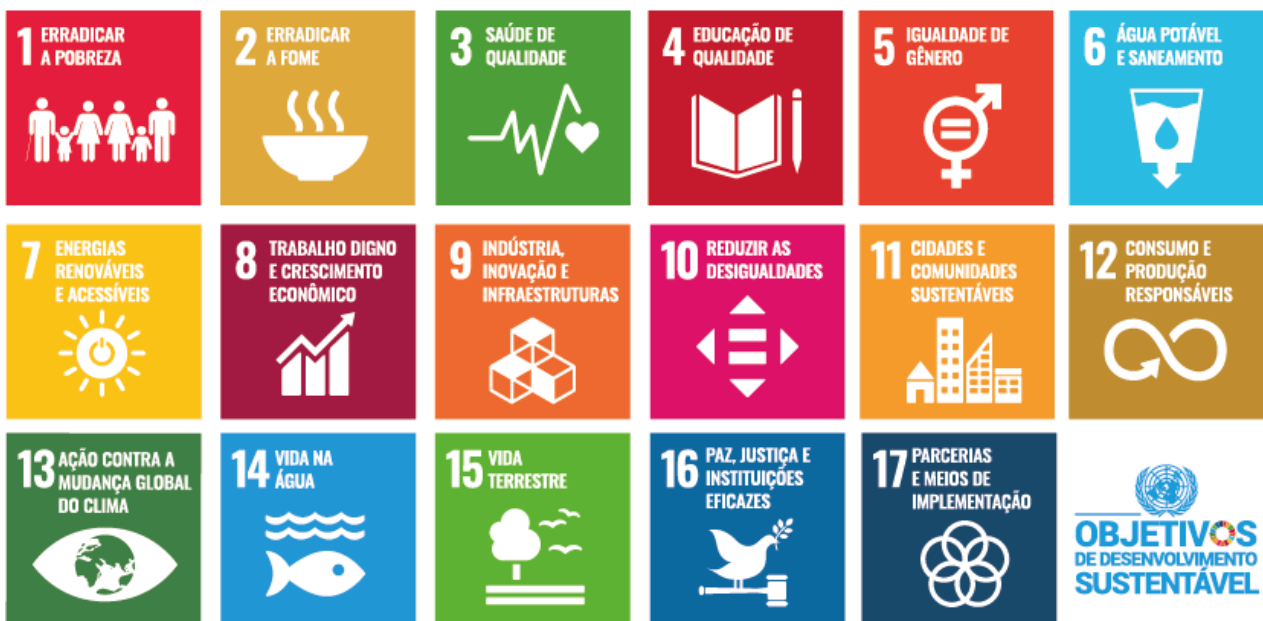
Figura 1. Descrição dos temas dos 17 Objetivos de Desenvolvimento Sustentável, Agenda 2030, da Organização das Nações Unidas.

Os Objetivos e Metas são o resultado de mais de dois anos de consulta pública intensiva e envolvimento junto à sociedade civil e outras partes interessadas em todo o mundo, prestando uma atenção especial às vozes dos mais pobres e mais vulneráveis (Figura 1).