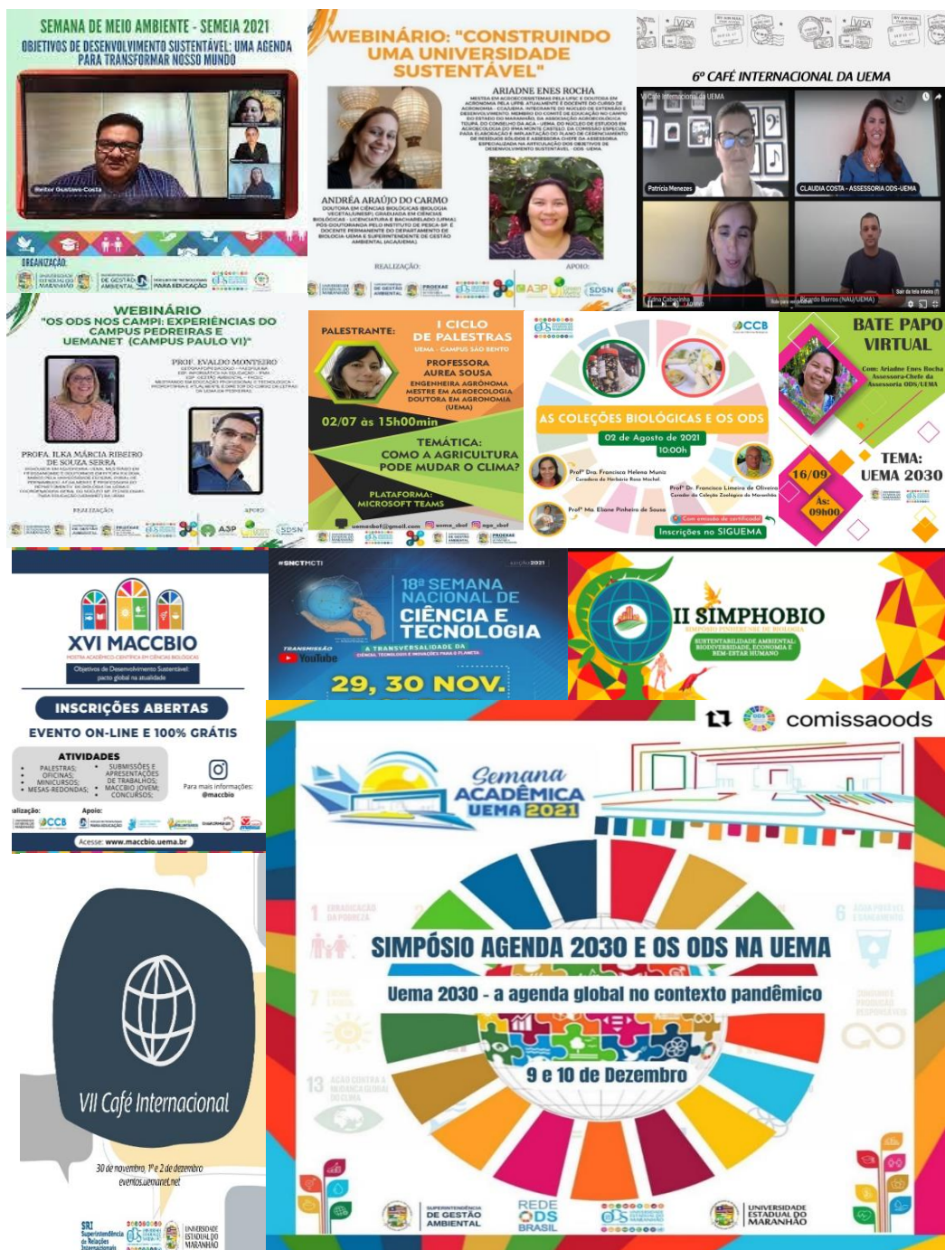
Figura 6. Eventos realizados na Uema, em formato remoto, articulados para a difusão da Agenda 2030 e os ODS na Uema.