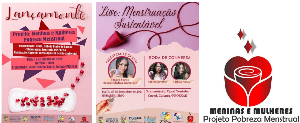
Figura 8. Divulgação do Programa Mulheres e Meninas – pobreza menstrual, Campus São Bento

com ações de atenção à saúde, educação, e assistência social. O projeto foi cadastrado como projeto de extensão junto a Pró-Reitoria de Extensão e Assuntos Estudantis.