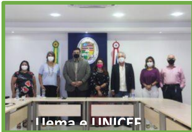
Figura 9. Registro das reuniões com o PNUD e o UNICEF com a Uema.