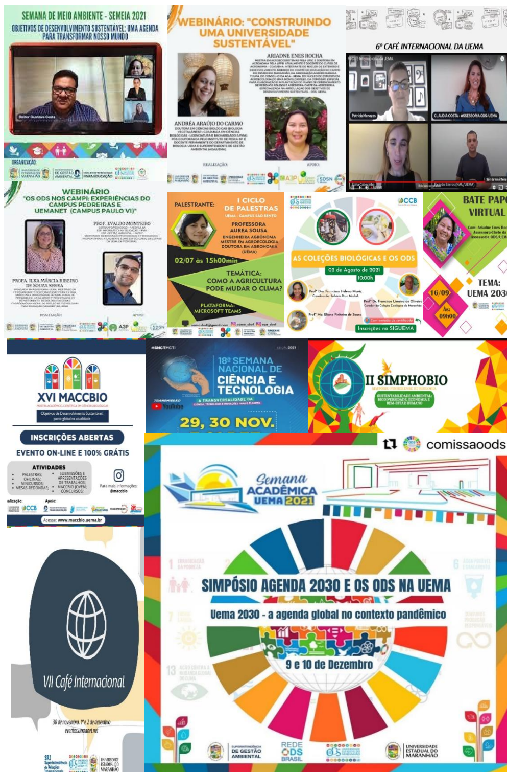
Figura 6. Eventos realizados na Uema, em formato remoto, articulados para a difusão da Agenda 2030 e os ODS na Uema.