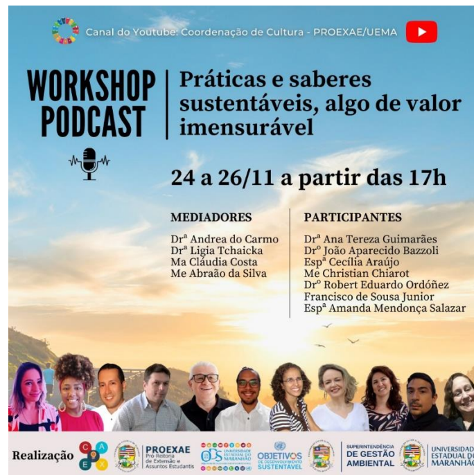
Figura 10. Arte de divulgação do Podcast Práticas e saberes sustentáveis, algo de valor imensurável.