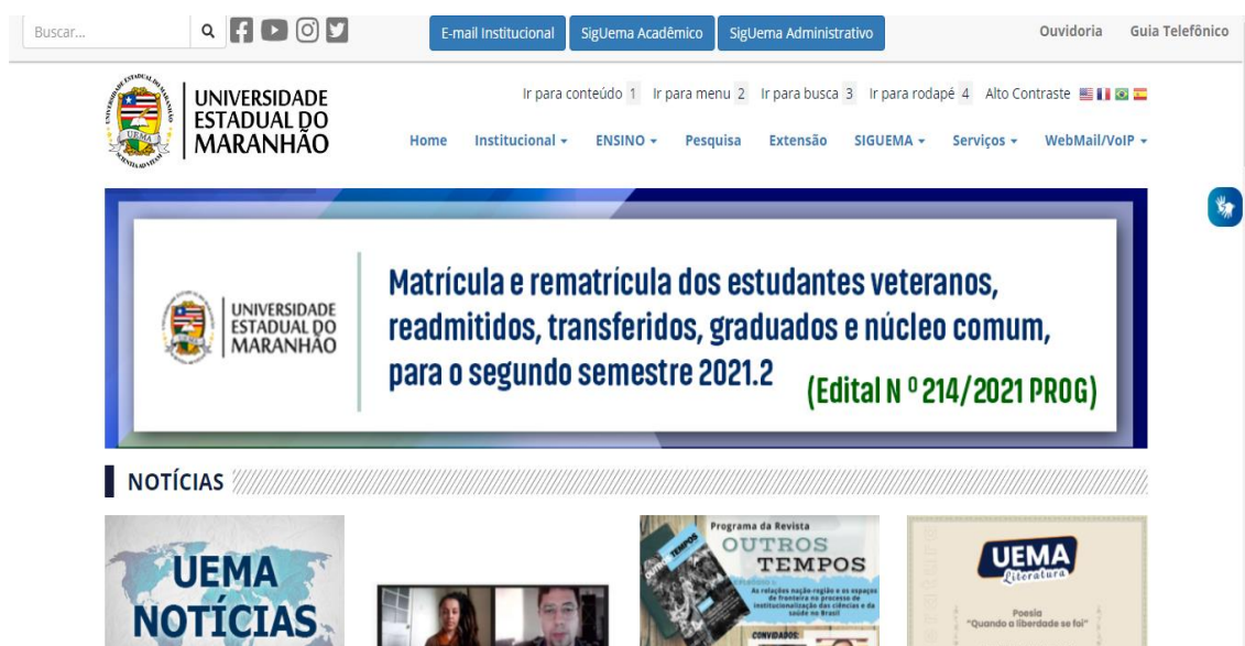
Figura 3. Imagem da página oficial da Uema (www.uema.br)