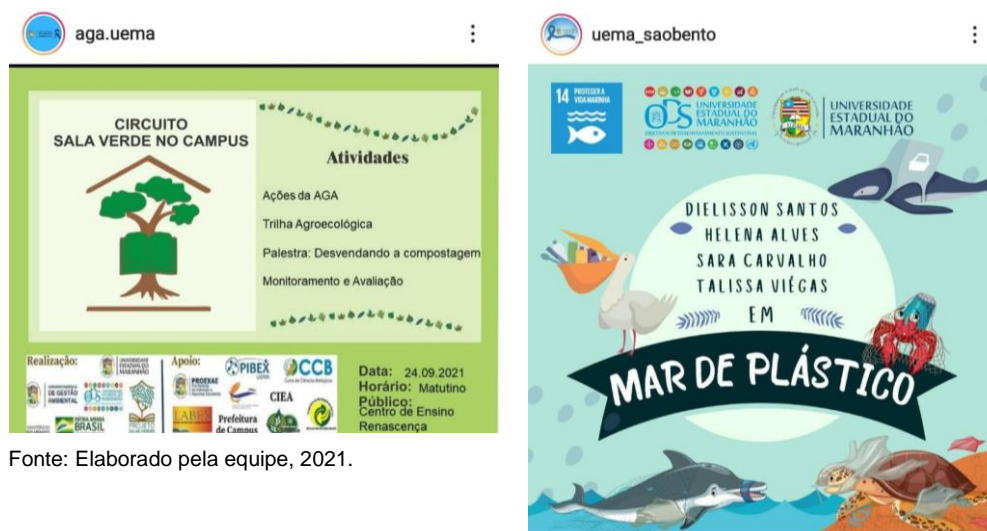
Figura 7. Exemplos de atividades articuladas aos ODS, com associação da identidade visual oficial do Selo ODS-UEMA.

Setores da Uema passaram a conhecer a Agenda 2030 e os ODS, bem como, reconhecer o vínculo das suas atividades com os ODS. A marca ODS Uema passou a ser adotada em trabalhos realizados com articulação evidenciada com os ODS (Figura 7).