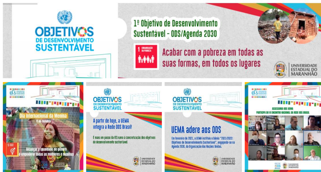
Figura 5. Exemplos de artes de divulgação das ações ODS Uema.