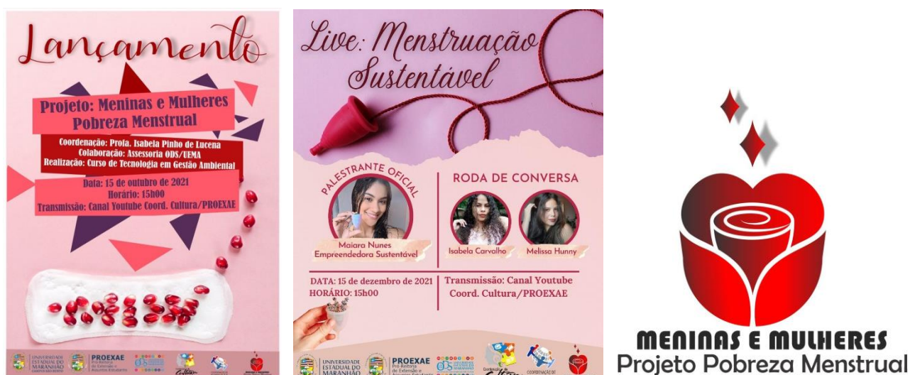
Figura 8. Divulgação do Programa Mulheres e Meninas – pobreza menstrual, Campus São Bento

O Curso de Gestão Ambiental do Centro de Ensino Superior de São Bentos elaborou, em parceria com a Assessoria ODS, o projeto do Programa Mulheres e Meninas – Pobreza Menstrual (Figura 8), com objetivo de discutir o empoderamento de mulheres e meninas com ações de atenção à saúde, educação, e assistência social. O projeto foi cadastrado como projeto de extensão junto a Pró-reitoria de Extensão e Assuntos Estudantis.