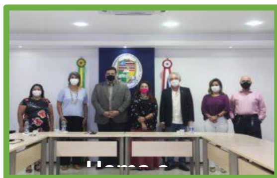
Figura 9. Registro das reuniões com o PNUD e o UNICEF com a Uema.

A busca ativa por parcerias locais e em estados limítrofes permitiu a articulação da gestão superior da Uema com o Programa das Nações Unidas para o Desenvolvimento – PNUD, Escritório de Projetos em Teresina (PI) e o Fundo das Nações Unidas para a Infância (UNICEF) no Maranhão, ambas com o propósito de apresentar as articulações da Uema com a Agenda 2030 e os ODS e avaliar as possibilidades de parcerias institucionalizadas.