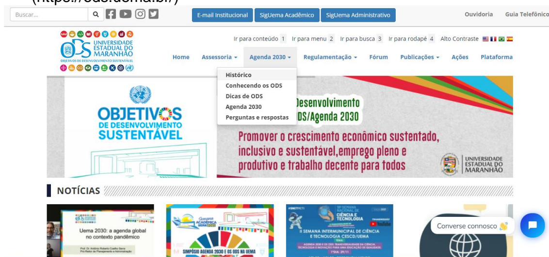
Figura 4. Página oficial da Assessoria Especializada na Articulação dos ODS na Uema ( https://ods.uema.br/ )