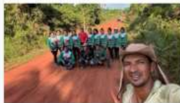
Viveiristas da aldeia Lagoa Comprida 27/7/2026