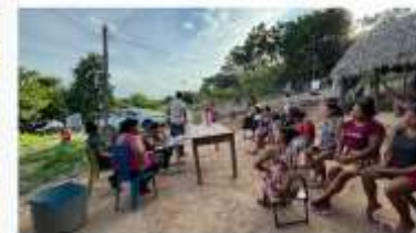
Indígena das aldeias Guajajara 14/11/2026