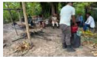
Mapeamento na Aldeia Lagoa Comprida (indígenas Isolados) Subheader goes here.