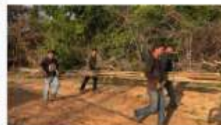
Viveiro Tukân Subheader goes here.